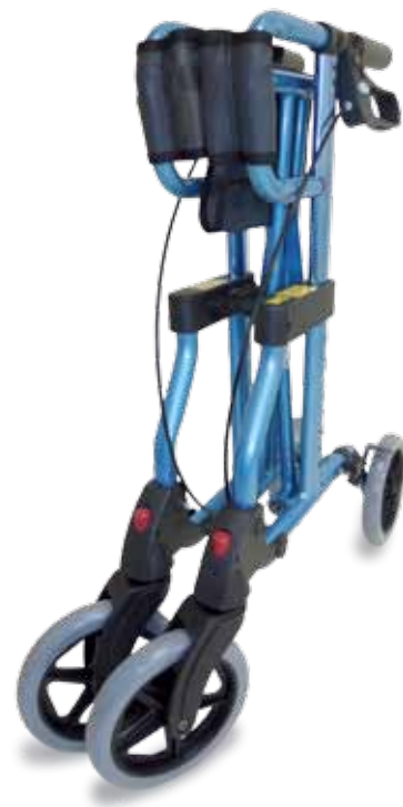
Abb. ähnlich * Irrtum und Änderungen vorbehalten