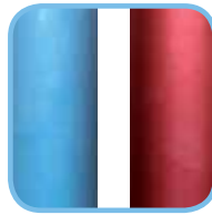
in zwei Farben erhältlich: Blau metallic, Rot metallic